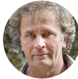
Alex Capus, Schriftsteller

Mit einer Live-Intervention von Jan Gehl aus Kopenhagen.